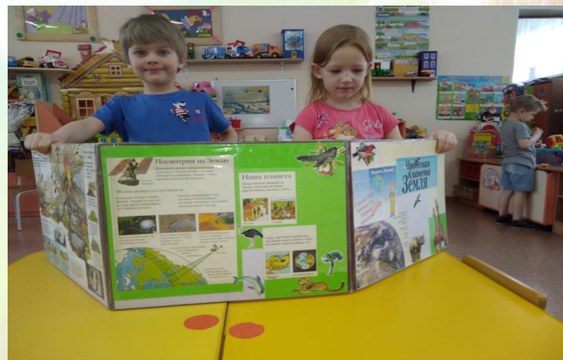
Фото -кейс «Помощники»

Цель : Формирование у детей бережного отношения к природе