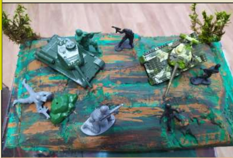
«Великая отечественная война»

создан для того, чтобы дети осознали и прочувствовали важность и трагедию долгих лет ВОВ, получили эмоциональный отклик в своих сердцах, испытали чувство гордости за свой народ и надолго сохранили в памяти события тех дней, а также познакомились с историей войн