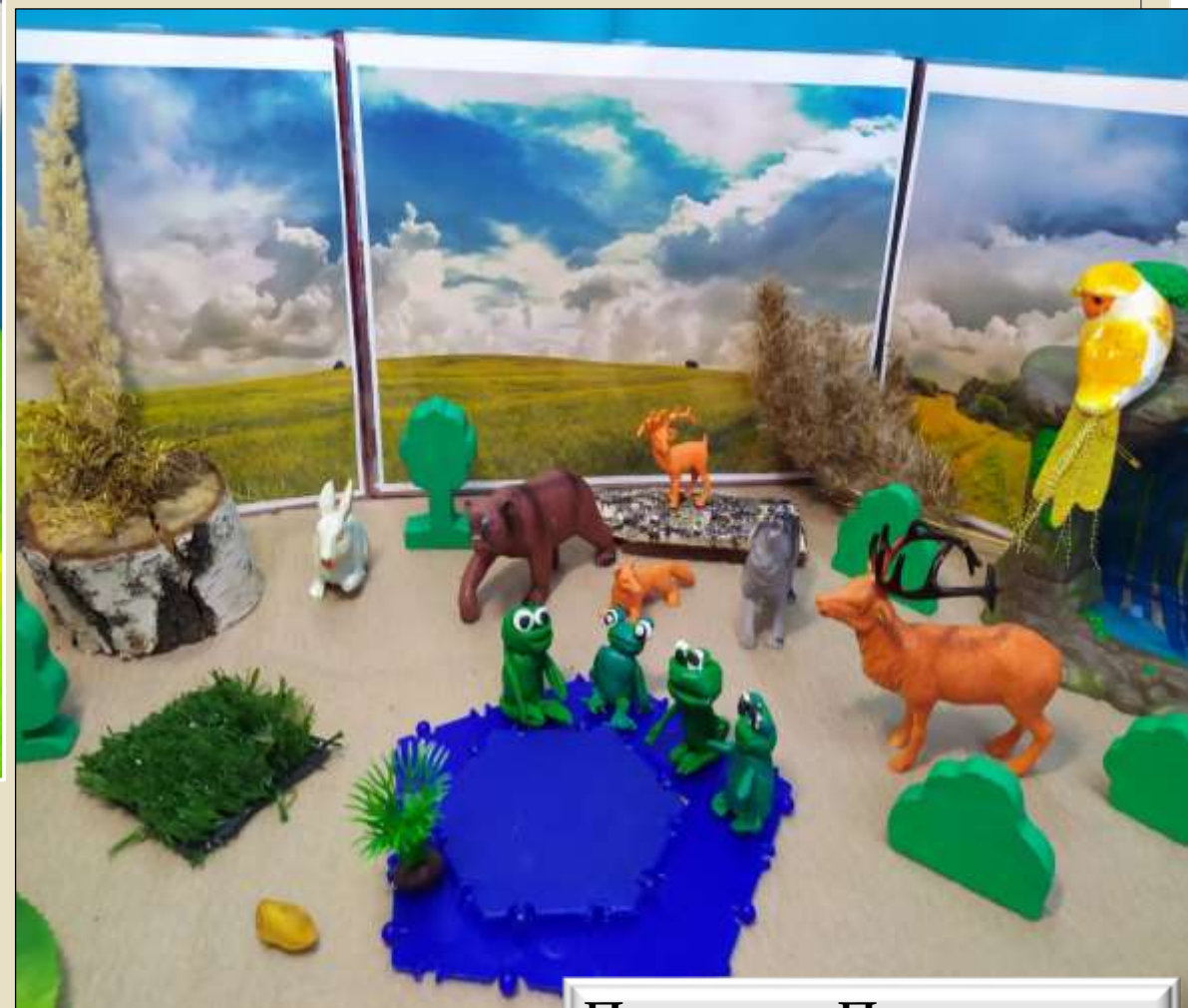
Панорама «Природа леса»

Для обыгрывания ситуаций мы используем «Панорамы» разных тематик (хозяйственный двор, Африка, ВОВ, природа леса, мир динозавров)