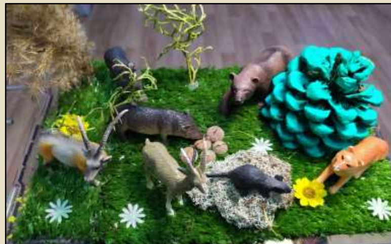
«Мир диких животных»