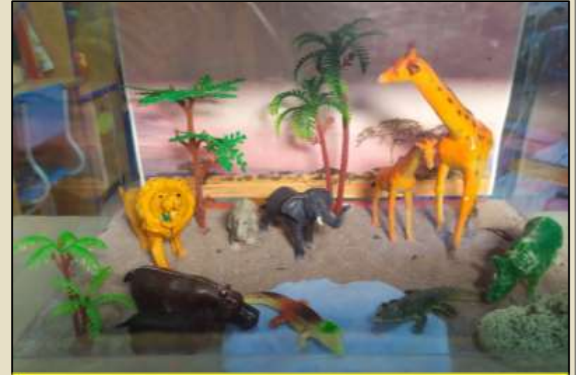
«Животные жарких стран»