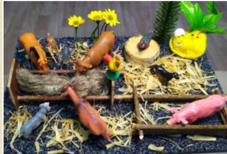
«Мир домашних животных»