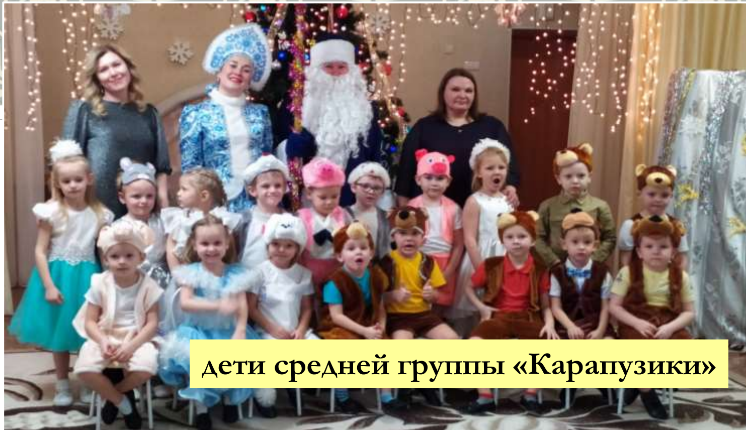
дети средней группы «Карапузики»