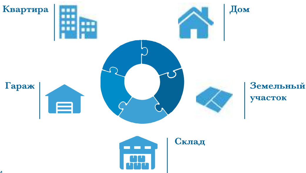
Схема 2. Основные объекты недвижимости

61. Указанию также подлежит недвижимое имущество, полученное в порядке наследования (выдано свидетельство о праве на наследство) или по решению суда (вступило в законную силу), право собственности на которое не зарегистрировано в установленном порядке (не осуществлена регистрация в Росреестре).